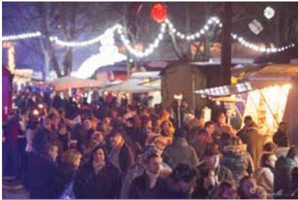
Féerie d'hiver en roulottes à Harchies