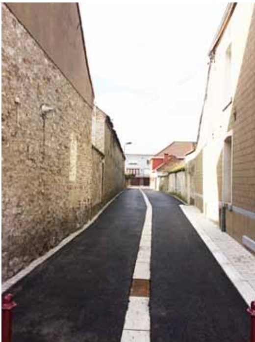
Réfection d'une ruelle à Blaton