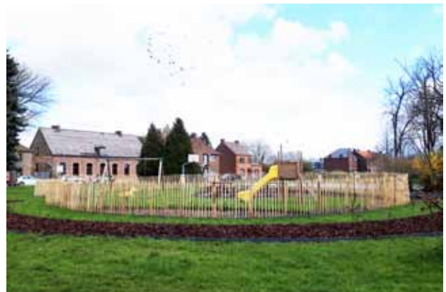
Plaine de jeux Place des Hautchamps