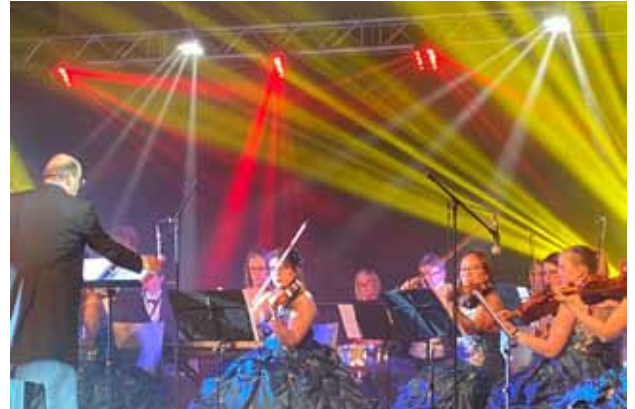
Concert Amadeus à la Maison rurale