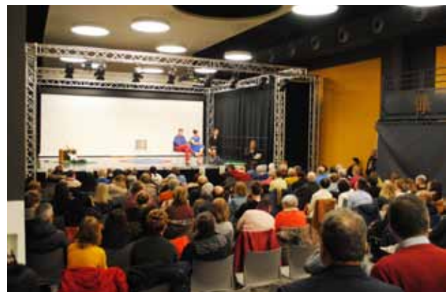
Pièce de théâtre à l'initiative du Plan de Cohésion Sociale