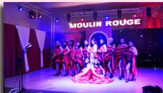
Spectacle Berni en chœur