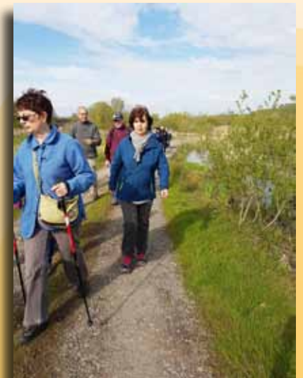
Marche à Condé (Bernissart, commune amie des aînés)