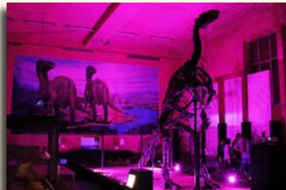
Nuit du musée de l'iguanodon