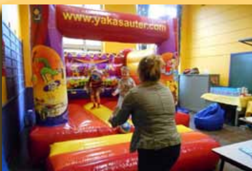
Family D, 112 bénévoles, 300 participants, 28 épreuves, 10 km de marche Facebook : Family D