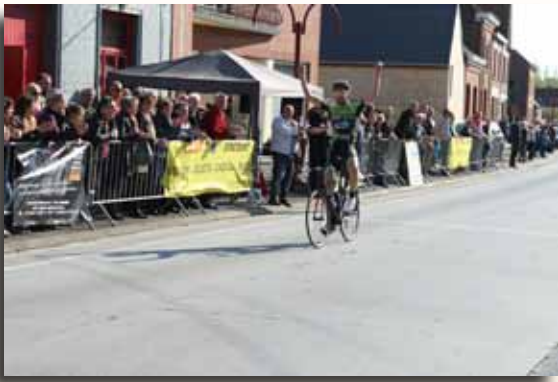
Grand Prix de l'Administration communale