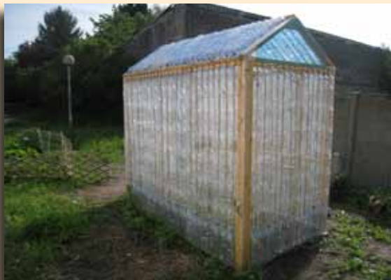
Serre réalisée à l'aide de bouteilles plastique par les enfants lors du stage de Pâques de l'île aux enfants