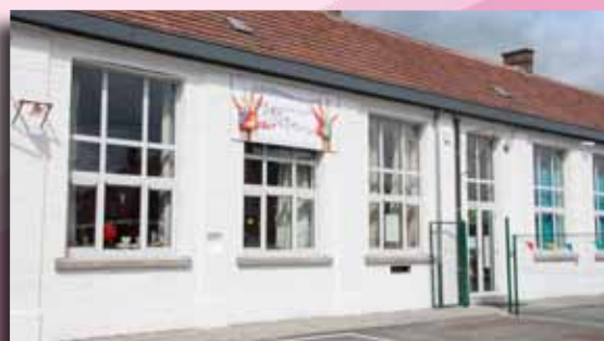
Façade rénovée à l'école d'Harchies