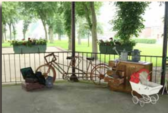
Rallye vélo vintage