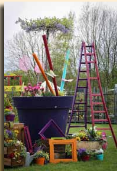
Parc en fleurs