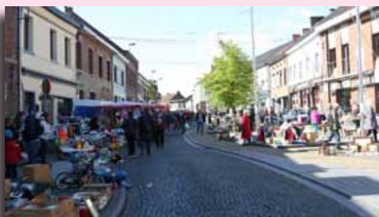
Brocante du 1 er mai