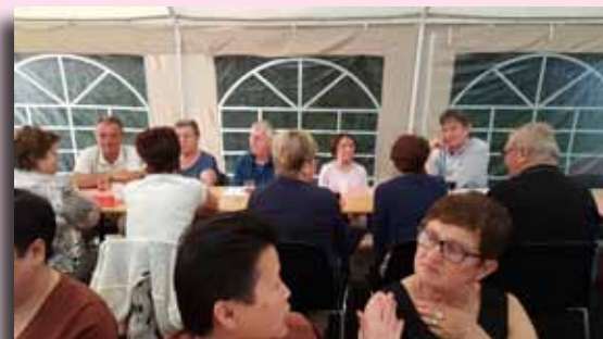
Fête des voisins