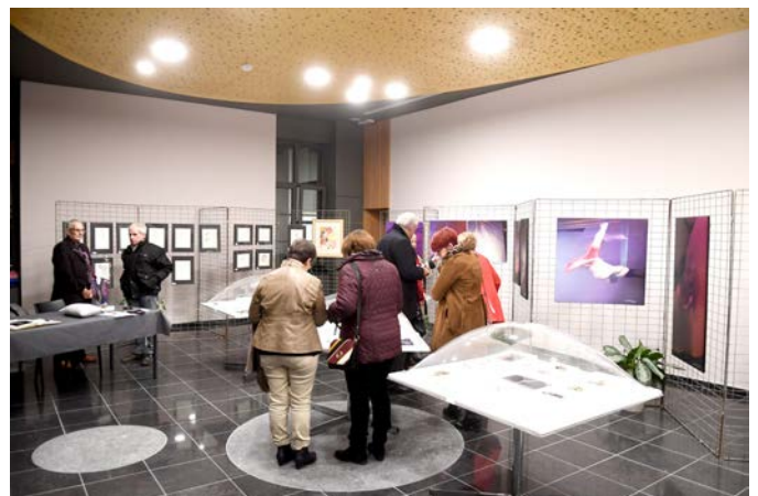
Exposition Christiguy à la Maison communale de Bernissart