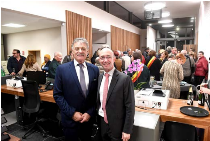
Inauguration de la Place et de la Maison communale de Bernissart