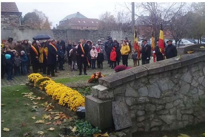
Cérémonies du 11 novembre