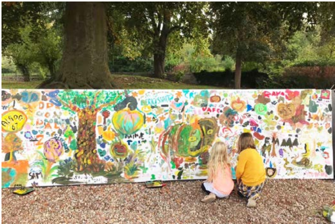
Parc en couleurs à Blaton